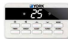
Wire Remote (อุปกรณ์เสริม)