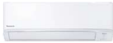
CS-KU9XKT | CS-KU13XKT | CS-KU18XKT