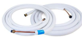
ท่อทองแดง