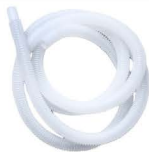
ท่อน้ำทิ้ง