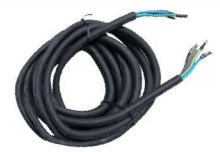
สายไฟขนาดยาว 4.3 เมตร