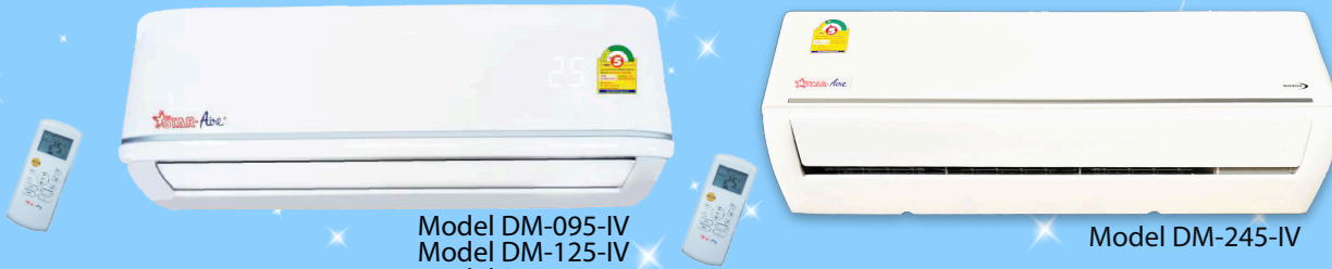
Model DM-095-IV Model DM-125-IV Model DM-185-IV Model DM-305-IV