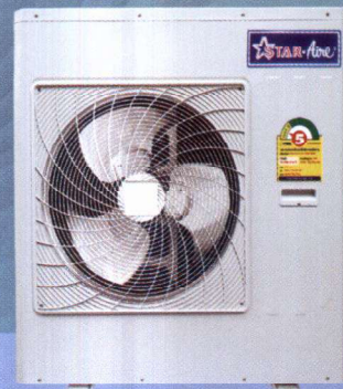
Model OR-365-A, OR 365-3A