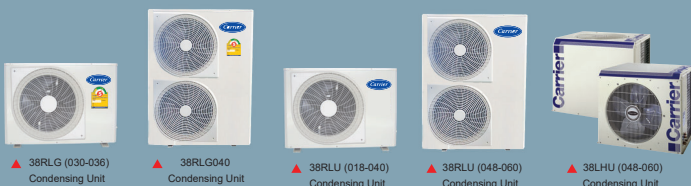
▲ 38RLG (030-036) Condensing Unit

(ยกเว้นรุ่น 38RLU036R100 มีเฉพาะ Hi pressure switch)