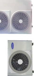
38RLU (048-060) Condensing Unit 38RLU (018-040) Condensing Unit

บริษัท แคนเรียร์ (ประเทศไทย) จำกัด 1858/63-74 ชั้น 14, 15 ถ.เทพรัตน กม. 4.5 แขวงบางนาใต้ เขตบางนา กรุงเทพฯ 10260 โทร. 0-2090-9999 แฟกซ์: 0-2751-4778